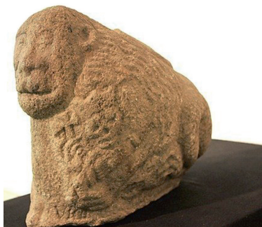
XIV a. „Žygaičių liūtas“. Skulptūra rasta 1931 m. Žygiaičių parapijoje (Tauragės apskr.) ties klebonija, prie Ežerūnos upelio.

Lankstinukas parengtas 2012-ųjų birželį.