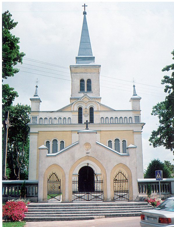
Žygiaičių bažnyčia 2009 m.