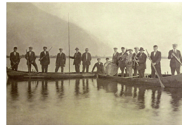
Žygiaičių dūdoniai Draudenių ežere 1928 m.