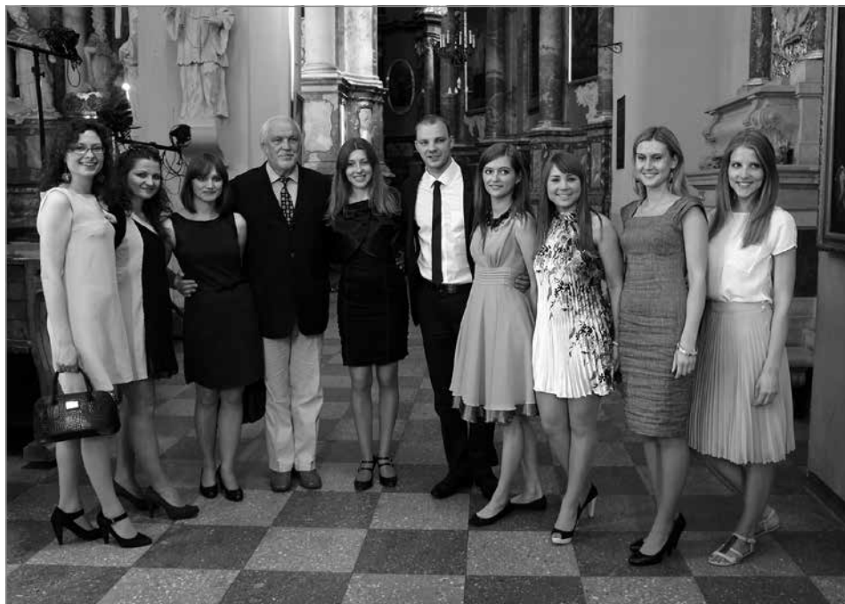
Su savo magistrantais Šv. Jonų bažnyčioje 2012 m.