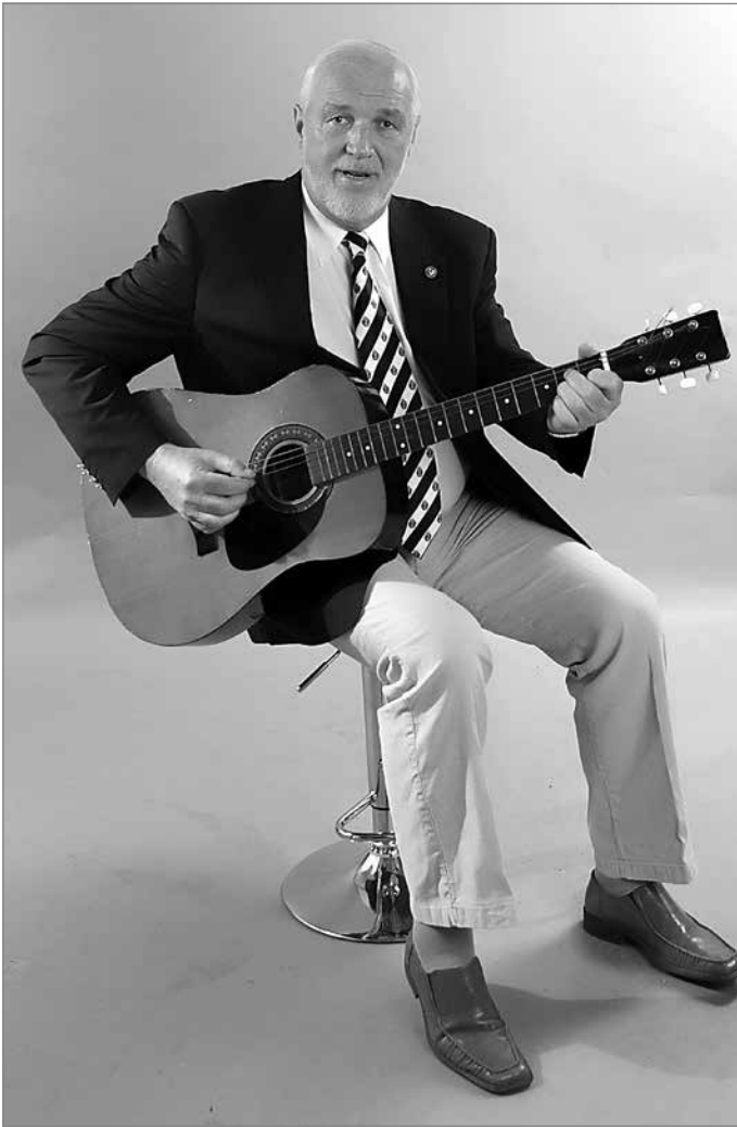
„Koks muzikos instrumentas po ranka buvo, tuo ir groti išmokome.“