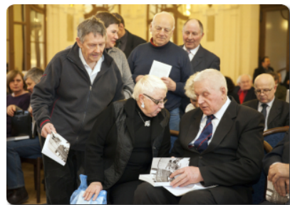
Mokslų akademijos salėje išsiriakavo eilutė norinčiųjų gauti autoriaus autografą.