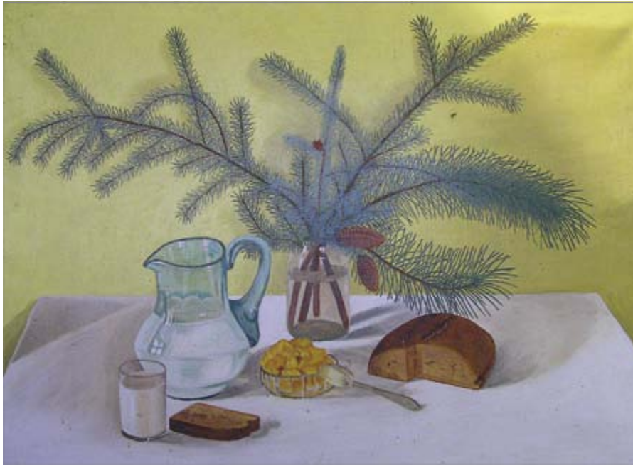
Pavakariai anūkams. 1981 m.