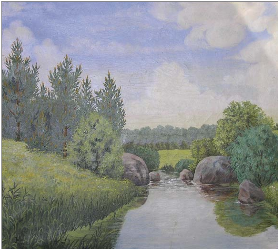
Daugyvenė. 1973 m.

„Jo istorijos gyvos ir šmaikščios, gamtos vaizdai spalvingi, sodrūs, o sakinyje visuomet sklاندus ir grakštus“.