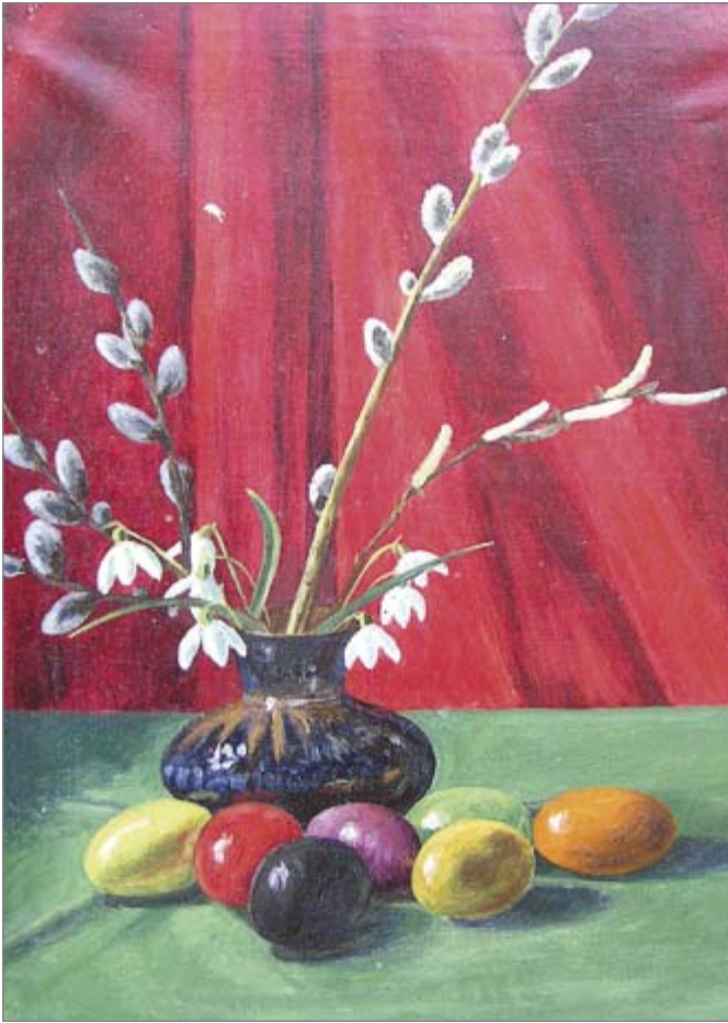
Velykos. 1967 m.