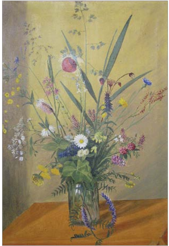
Joninių puokštė. 1967 m.