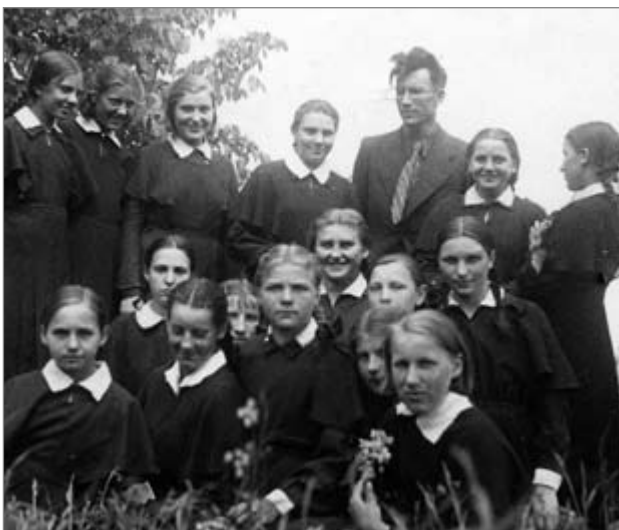
Su Šeduvos progimnazijos auklėtinių grupe. 1940 m.