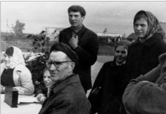
Pedagogas (pirmame plane) sporto varžybose Rozalime