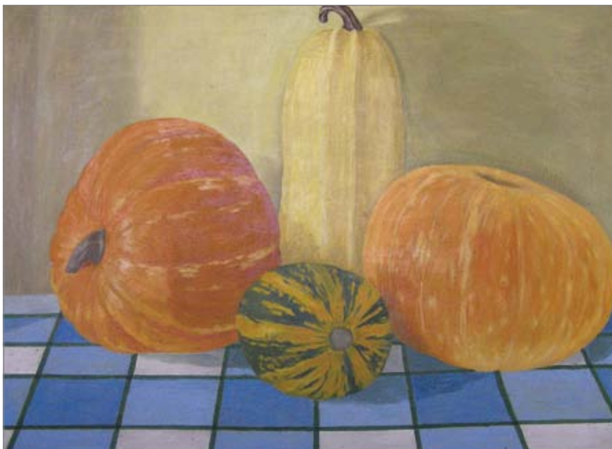
Natiurmortas su moliūgais. 1977 m.

pagoniškų sakmių personifikuotame unikaliame atkūrimė bei tapyboje – portretuose, peizažuose, natiurmortuose, taip pat įvairių renginių, afišų, plakatų, lozungų bei kt. įvykių meniniame apipavidalinime... Netrūko ir fantastinių vizijų, o ir „smagių“ eilėraščių bei anekdotų išilusiam šeimos ar bičiulių ratui su naminio putino ar šermukšnių vyno stiklu rankose. Meilė Lietuvai ne-