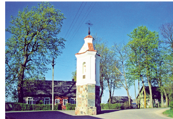
Blaiivybės paminklas Skapiškyje, atstatytas 1990 m.