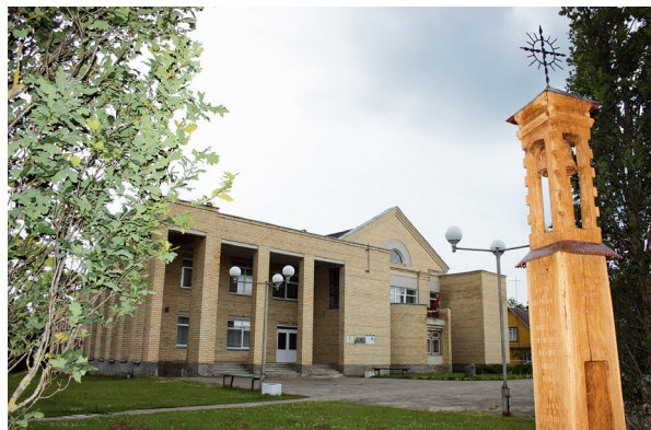
Miestelio centras. Skapiškio kultūros namai ir medžio skulptūra, sukurta Maironio 150-osioms gimimo metinėms, atidengta 2012 m. Meistras – Bronius Bickus.