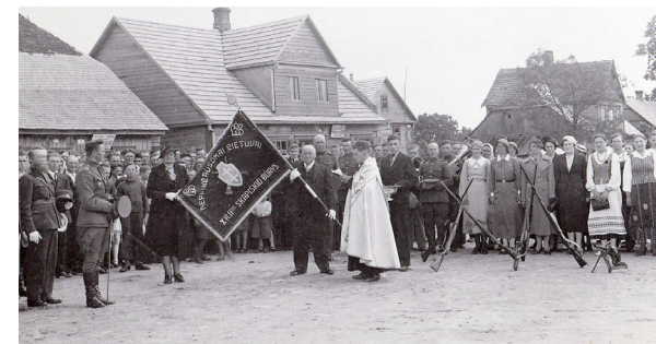
Skapiškio šaulių vėliavos šventinimas. XX a. 4-asis dešimtmetis.