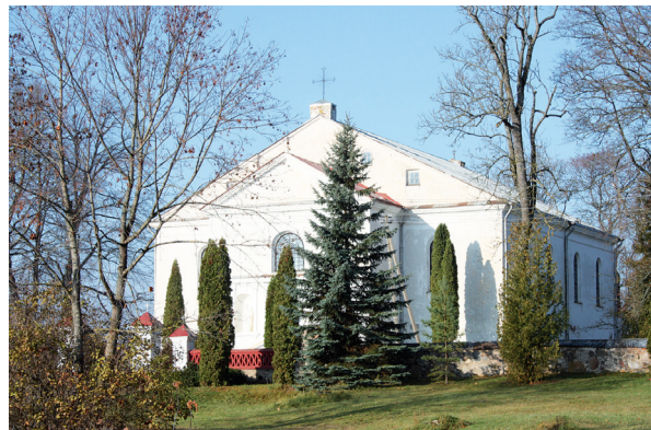
Skapiškio Šv. Hiacinto (Jackaus), buvusi dominikonų bažnyčia, 2011 m.