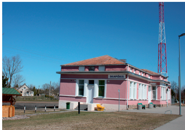
Skapiškio geležinkelio stotis, 2013 m.