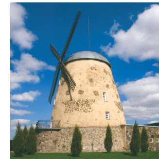
Šeduvos XX a. pr. vėjo malūnas, 1967 m. pertvarkytas į pakelės užėigą