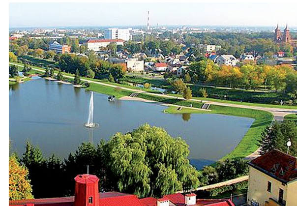
Senojo Panevėžio panorama.