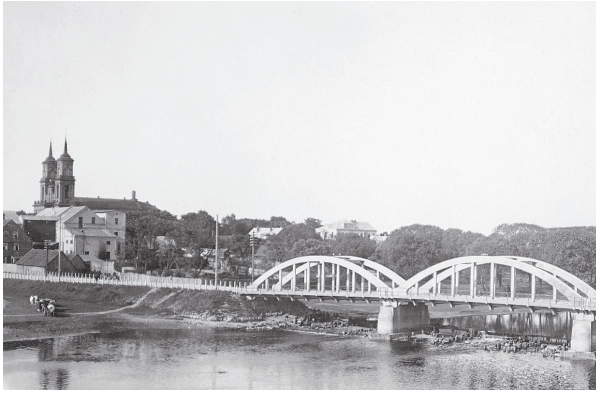
Senoji Panevėžio panorama su Laisvės tilto fragmentu. 1925–1940 m.