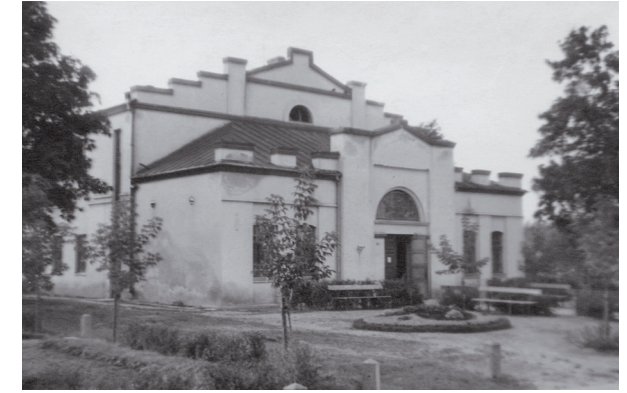
Filantropo Stanislovo Montvilos dar 1913 m. darbininkams šviesti įrengtas teatras. 1940 m. jame pradėjo veikti Lietuvą garsinantis Juozo Miltinio vadovaujamas Panevėžio dramos teatras