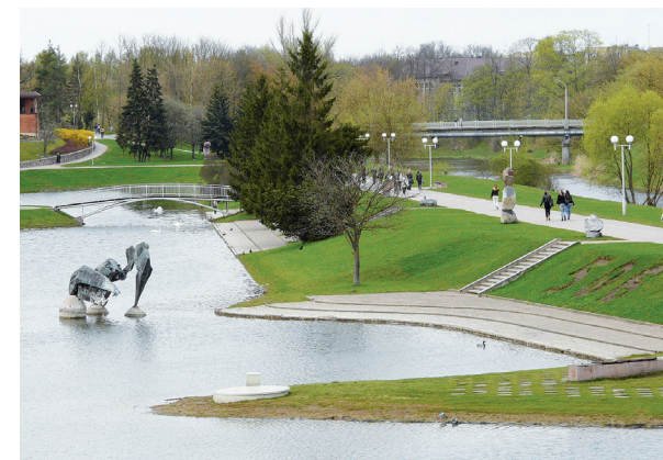
Amžius sujungusi Panevėžio miesto centrą puošianti Senvagė, XX a. atsikračiui „balos“ vardo, pradėjo puošti originaliomis skulptūromis, mažosios plastikos kompozicijomis ir poilsiaujančių miestiečių šypsenomis