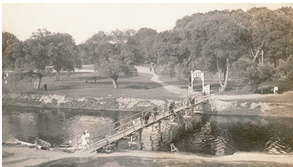
Vytauto Didžiojo parkas, nuo seno žinomas Skaistakalnio vardu. Apie 1930 m.

2012 m. „Versmės“ leidykla surengė 27 ekspedicijas – 26 kompleksines lokalinių tyrimų „Lietuvos valsčių“ serijos monografijų autorių ekspedicijas (iš jų 9 pakartotines) ir vieną archeologinių kasinėjimų ekspediciją į rengiamose serijos monografijose aprašomas vietas.