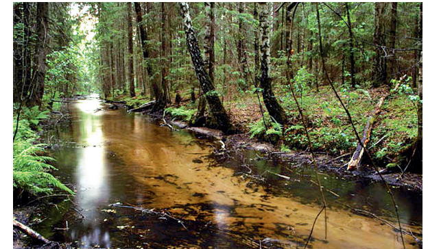
Labanoro girioje, slėpiančioje išraiškingą reljefą ir natūralias pelkes, gausu uogų ir grybų, įspūdingų vandens maršrutų, todėl ji traukia keliautojus