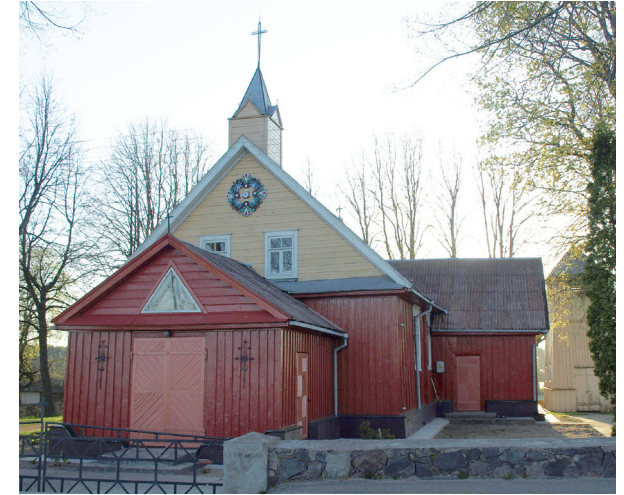
Reškutėnų gyventojus kiekvieną sekmadienį į net dvi valandas trunkančias mišias kviečia Šv. Izidoriaus bažnyčios varpai