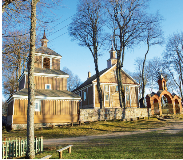
XIX a. pradžioje statytą Labanoro Švč. Mergelės Marijos Gimimo bažnyčią, kurioje kabėjo stebuklingu laikomas švč. Dievo Motinos paveikslas, 2009-aisiais pasiglemžusi ugnis neįveikė tikrai varpinės