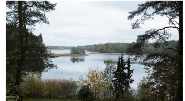
Žeimenio ežeras prie Kaltanėnų yra toks siauras ir ilgas, kad primena upę