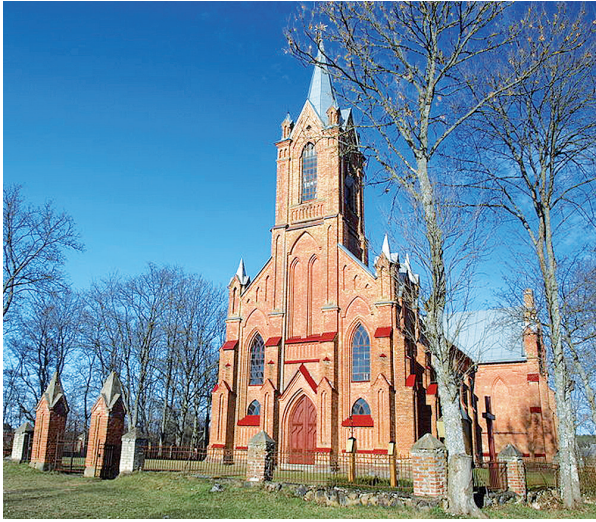
Kaltanėnų Švč. Mergelės Marijos Angeliškosios bažnyčia garsėja itin vertingais vėlyvojo baroko altoriais