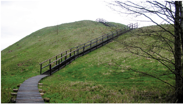
Pietiniame Veisiejų ežero krante stūkso Paveisininkų piliakalnis. Jį tyrinėjant aptiktas kultūrinis sluoksnis su grublėtąja keramika bei įvairiems būdingų sudegintų mirusiųjų kapų, datuojamų I tūkst. pr. Kr.