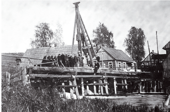
Tilto per Niedos upę statyba XX a. šeštajame dešimtmetyje.