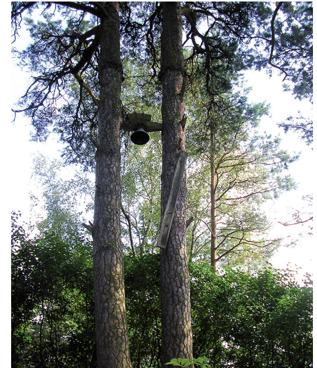
Varviškės senosiose kapinėse tarp dviejų pušų kabo sudegusios kaimo koplyčios varpas.