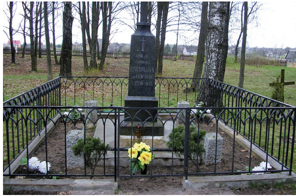
1831 m. gruodžio 23 d. Justinavo dvare mirė sukilimo dalyvė, kapitonė, pėstininkų pulko I kuopos vadė grafitė Emilija Pliaterytė. Palaidota Kapčiamiesčio senosiose kapinėse.