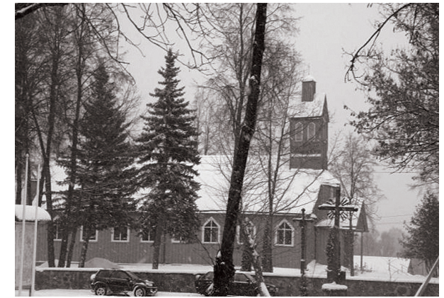
Kapčiamiesčio Dievo Apvaizdos bažnyčia.