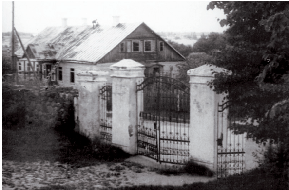
Kapčiamiesčio klebonija iki II pasaulinio karo.