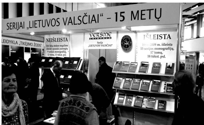
Vilniaus knygų mugėje prie „Versmės“ leidyklos stendų