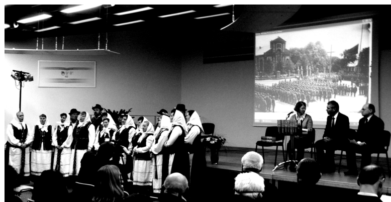
"Versmės" knygų pristatyme liūdėti neteko