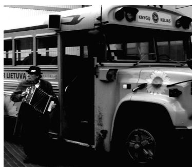
"Versmės" „bibliobusas“ pasirengęs vykti į Širvintų kraštą

Pažymėtinas ir Liukonių dvaras, paskutiniojo LDK didžiojo etmono, generolo leitenanto Simono Kosakovskio rezidencija. Etmono pastatyti dviejų aukštų rūmai po jo mirties 1794 m. kovo 25 d.