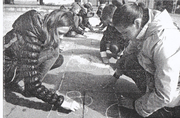
Kupiškio Povilo Matulionio progimnazijos 5b klasės mokiniai prieš renginį puošė savo piešinius miesto aikštę.

Praėjusį penktadienį nuo pat ryto Kupiškio Gedimino gatvėje buvo išdėlioti rajono mokyklų mokinių geriausi tapybos darbai, vaizduojantys Kristaus Žengimo į dangų bažnyčią ir jos interjero detalės, o Etnografijos muziejuje atidaryta rajono tautodailininkų tapytų paveikslų, kuriuose vaizduojama vienuolika rajono šventovių, jų nuotraukos su aprašymais, bei medžio skulptūrų religine tematika paroda „Kupiškio dekanato bažnyčios“.