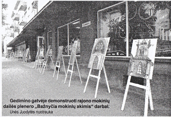
Gedimino gatvėje demonstruoti rajono mokinių dailės plenero „Bažnyčia mokinių akimis“ darbai.