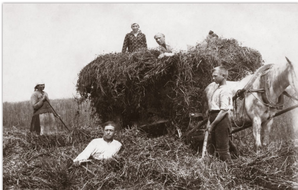
Šienapjūtė Vilūnaičiuose apie 1929 m.

Likusi Vilūnaičių kaimo žemė buvo dirbama. Visi laukai iki Ropidų ir Balos, iš kitos pusės iki Aleknaičių kaimo sienos buvo sėjami. Kitaip tariant, laukai abipus Vilūnaičių kaimo vieškelio buvo sėjami. Daugiausia sėdavo žiemkenčių rugių, kviečių. Ūkininkai, turintys 30 ha žemės, maždaug pusę jos apsėdavo, o kitą pusę palikdavo ganykloms, šienaujamos pievoms.