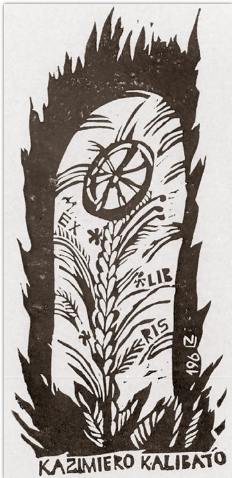
K. Kalibato ekslibrisas.