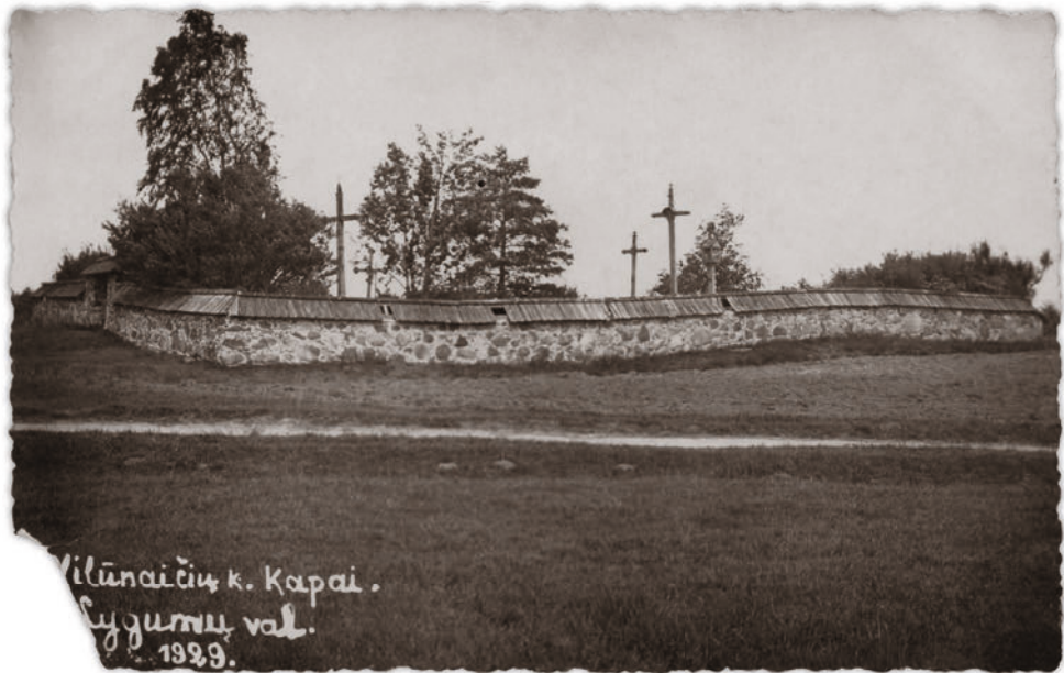
Vilūnaičių kaimo kapai 1929 m.

Iš vakarų, pasukus rytų link, kaimą riboja už Vilūnaičių kapelių, valdiško miško pakraštyje einantis keliukas (iki Paliečių kaimo). Pasukus į šiaurę Vilūnaičių žemę riboja nuo Paliečių einantis keliukas, šalimais Paliečių miško, toliau Vilūnaičių parmiške iki Juknaičių dvaro žemės.