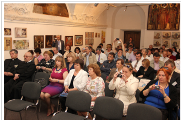
Konferencijos dalyviai Lvovo religijų istorijos muziejaus salėje

Straipsnio autorė nuo 2006 metų aktyviai dalyvauja mokslinėse Lvovo Religijų istorijos muziejuje vykstančiose konferencijose: skaito pranešimus, vadovauja sekcijoms, dalyvauja diskusijose, kviečiama į prezidiumus.