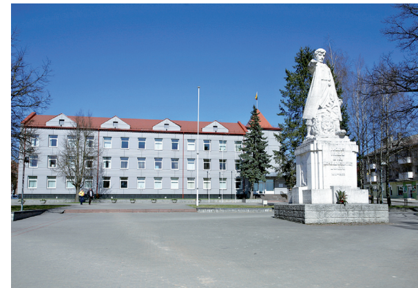
Skulptoriaus V. Grybo legendinė skulptūra miesto centre simbolizuoja žemaičių stiprybę, valią, jėgą, ryžtą ir atkaklumą