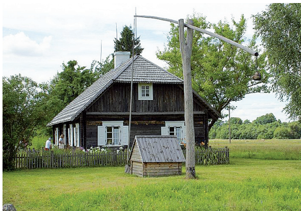
Maironio gimtinėje Pasandravyje kasmet vyksta tradicinis „Poezijos pavasarėlis“