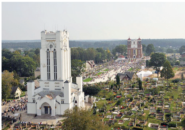
Šiluvoje kasmet rengiami Mergelės Marijos gimimo atšaidai, sutraukiantys tūkstančius maldininkų