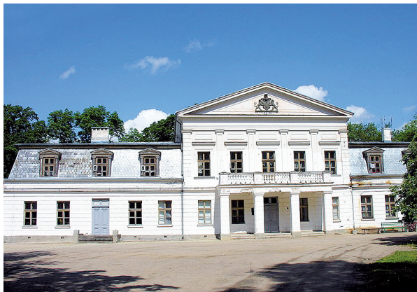
Istoriniuose šaltiniuose Senosios Žagarės dvaras paminėtas dar XV a.