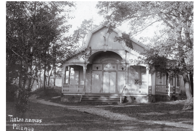
Teatro namas Palangoje.