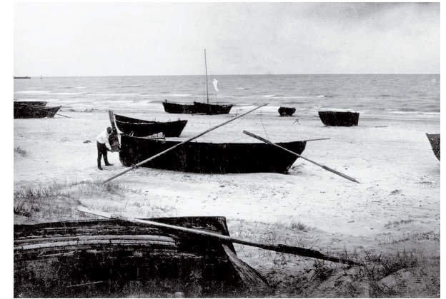
Palangos žvejų uostas