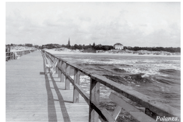
Vaizdas nuo legendinio Palangos jūros tilto.