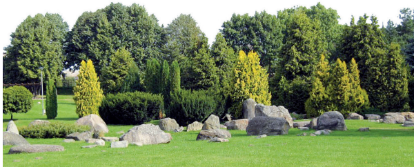
Mosėdžio akmenų muziejaus panorama