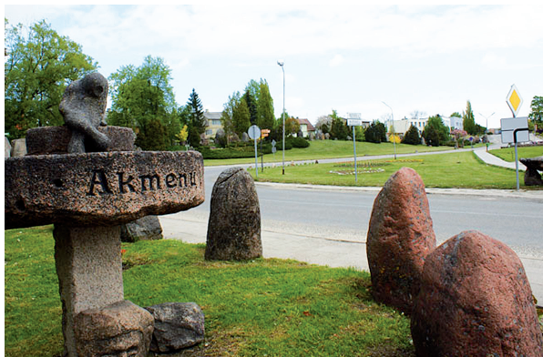
Pakeliui į Mosėdžio akmenų muziejų