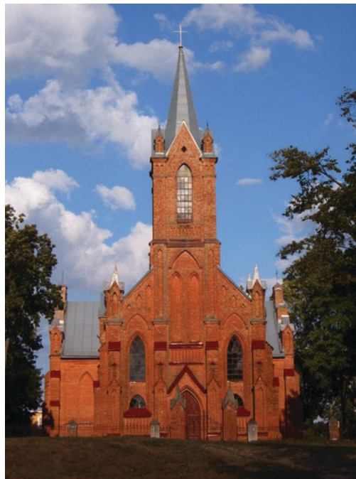
Kaltanėnų Švč. Mergelės Marijos Angeliškosios bažnyčia